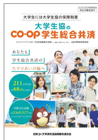
CO・OP学生総合共済パンフレット

③ 保護者の方も使える「学生生活無料健康相談テレホン」 からだところに関する悩みに、専門の相談員がお答えする「からだところの健康相談」、一人暮らしで困ったことサポートを行う「くらしの相談」。 どちらも、 学生総合共済加入者 と、その 保護者の方がご利用 いただけます。