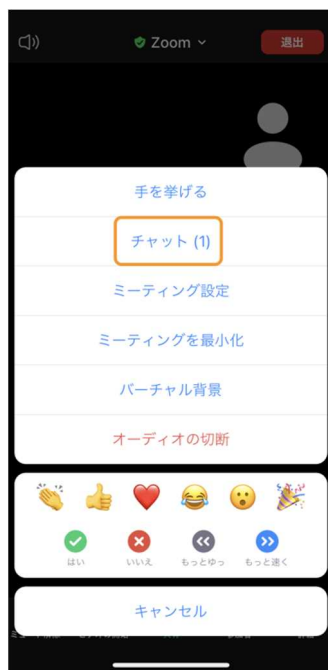
「チャット」をタップ