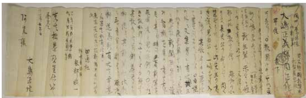
一八七六年十一月二十六日付け大島正義宛て大島正義書簡 (大学文書館蔵)

回想や伝記、評論などを基に語 られる場合が多いようです。さ らに、クラークに心酔する後世 の人々が、自身の理想をクラーク の言動の中に読み込み、自身 の思い入れを重ね合わせて論じ ています。それはクラークのス ピンオフ・ストーリーと言って 良いと思います。そうしたスピ