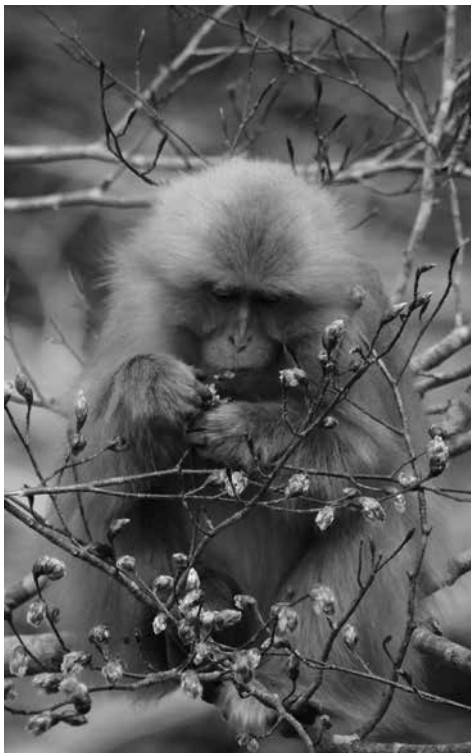
フナの花を食べるサル。

さて、わたしたちを楽しませてくれる山菜ですが、住んでいる地域によってはサルも大好きです。下北半島のサルは、行者ニンニクやハリギリを好んで食べるのだそうです。サルと人間が食べる時期がちょうどぴたりで、木の上でハリギリをほおぼるサルのおこぼれを嬉々として拾う観察者もいるのだとか。行者ニンニクはご存知のように香りが独特です。火を通せばお上品なニラのようでもありま