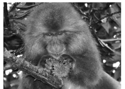
栗はごちそう。手や口でいがを外します。

すが、生で食べると少量でも翌日の口臭に響きます。エチケット的に、ちよつと注意の必要な山菜でもありますよね。口臭は分かりませんが、行者ニンニクを食べる時期のサルの糞は強烈なニンニク臭なんだそうです。