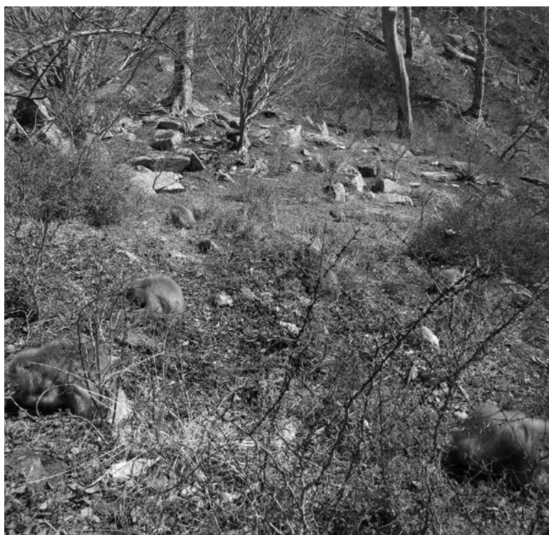
冬の食事風景。みな枯草に紛れて地下茎をほじくっています。

るような美味しいものばかり ではありません。例えば、朴 葉みそなどに使うホオノキ をご存知でしょうか？花や葉 は強い芳香を放ちますが、種 子も独特の強い香りがしま す。触っていると指がぴりぴ りしびれてくる刺激的な種子 ですが、これを主食にするこ ともありません。大量のよだれ を垂らしながら食べる場所 を見ると、サルにとっても刺 激的なものかもしれません。激 辛スープカレーをひいひい言 いながら食べる感じでしょう か。それでも、秋には脂肪分 や糖分たっぷり、舌の肥え た(?)ヒトでも美味しく食 べられる食べ物が多くなりま す。ブナやケヤキの実は大さ いけれどクルミのようなナツ ツの味わいがあるし、ガマズ ミの実には酸味と甘みのバラ ンすがばっちりです。小腹がす いたらそこらのものをつまみ 食いできるのも、秋の調査の 楽しいところです。サルたち は、秋に栄養豊富な食物をた くさん食べて、体に脂肪を蓄 えます。