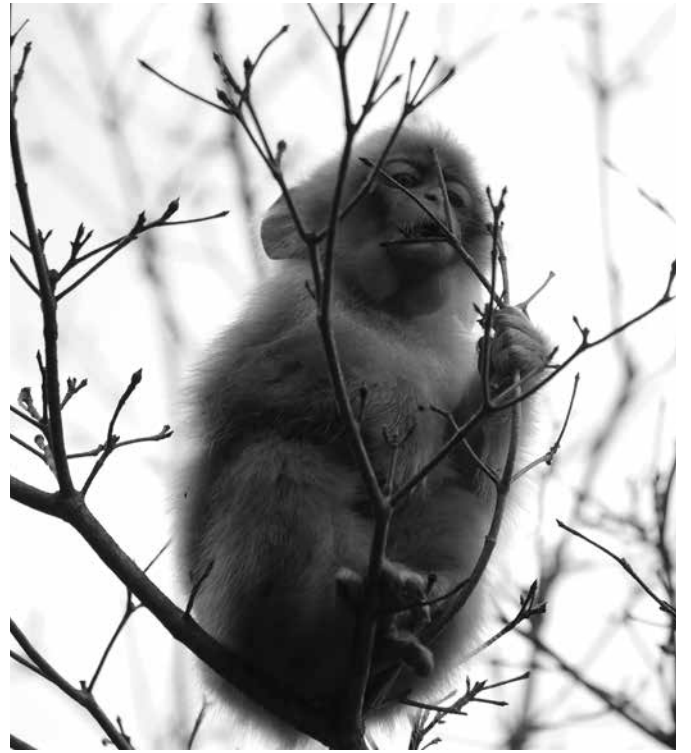
冬芽を食べるアカンボウ。頬袋がパンパンになっています。

てついつい早足になってしま います。キノコ探しに気を取 られるあまり、群れの仲間を 見失ってしまうアクシデント もしばしばです。 ところで、キノコはちょっ とずつしか生えていないので、 せっかくな見つけても他のサル に食べられてしまったら別の を探さなくてはなりません。 あんまりのんびり食べていて も、群れの仲間からはぐれて しまいそうです。そんな時に 便利なのが頬袋です。ほっぺ の下の皮膚が伸びて、キノコ