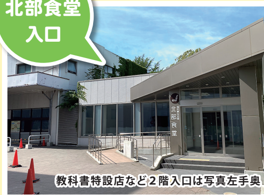
教科書特設店など2階入口は写真左手奥