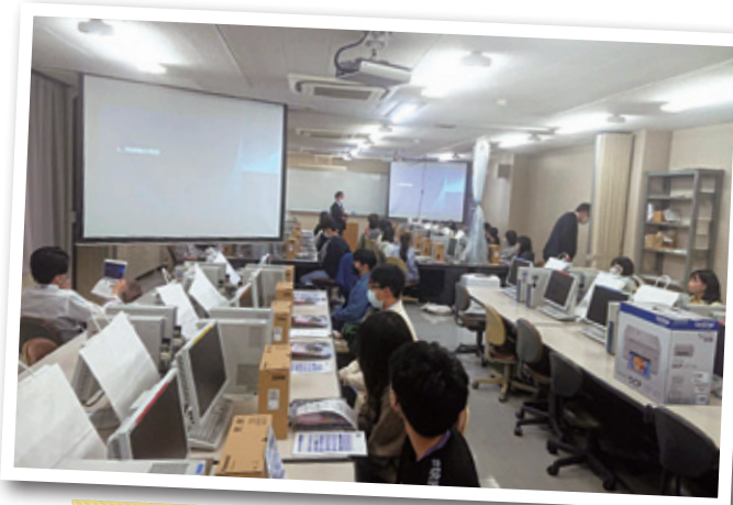
セットアップ講習会の様子（2023年4月）