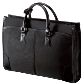
バッグ各種 例) 8,800円(税抜)の品