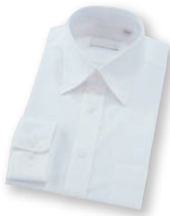
ワイシャツ各種 例) 1,900円(税抜)の品