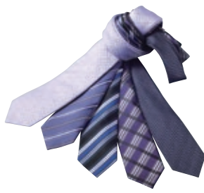
ネクタイ各種 例) 1,900円(税抜)の品