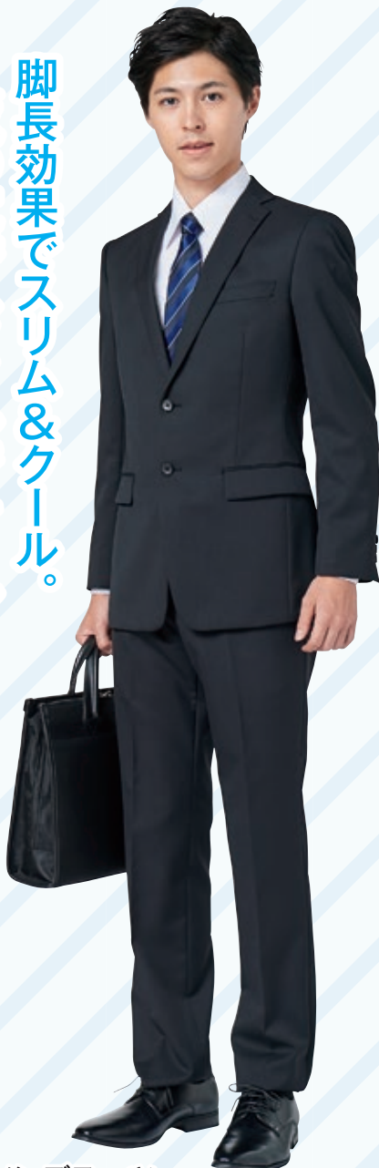
メンズスーツ 例) 18,000円(税抜)の品